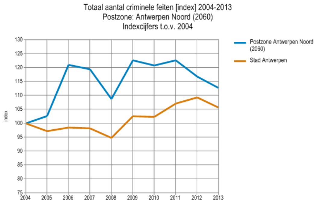
Grafiek 2: Evolutie (Index 2004) geregisteerde criminaliteit in Postzone: Antwerpen Noord (2060) en Stad Antwerpen